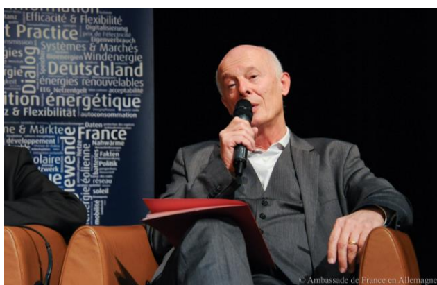
Prof. Dr. Dr. h. c. Hans Joachim Schellnhuber, Directeur émérite, Institut de Potsdam sur les effets du changement climatique (PIK)